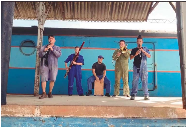
El grupo musical Raptus es uno de los competidores con más obras presentadas al festival. Fotograma del videoclip El tren del mañana . Autor Henrys Pérez.