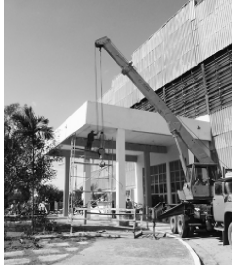
A la espera del «Playa Girón» de boxeo, la Sala Amistad reanimó sus áreas.

plantas y mejorado la vista a la entrada principal. Nos quedan los cristales rotos, sacamos los que están por caer y son un peligro real, porque esa inversión sí que no se pudo acometer. Otra cosa que nos favoreció fue el nuevo cartel luminoso que anuncia el nombre de la Sala. Es un cambio total. El «Girón» le ha venido perfecto.