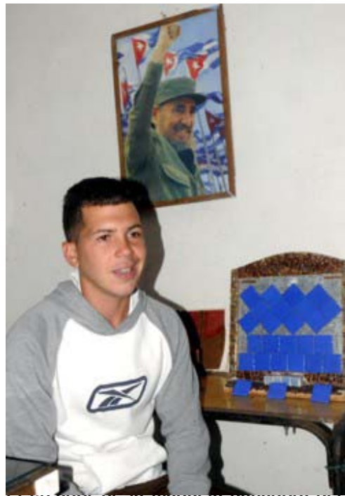
El creador de la maqueta ganadora del concurso de la OCPI es también Premio Relevante en el Fórum Provincial de Ciencia y Técnica.

Oficina Cubana de la Propiedad Industrial