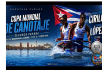
Las dos principales figuras del canotaje cubano, luego de conquistar la presea de plata en el C2 a 200 metros en la Copa de Brandenburgo.

Este par de metales se suma a los alcanzados una semana antes en la Copa realizada en Szeged, Hungría, donde ambas dominaron la modalidad de C2 a 200 metros, y posteriormente, el domingo 10 de mayo, en una fecha tan significativa como es la celebración del Día de las Madres, Cirilo se adjudicó el